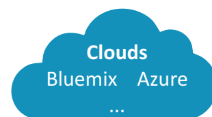
Clouds Bluemix Azure ...