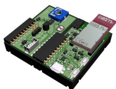
Sensor kit temperature, light intensity and voltage