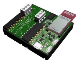
Relay kit switch connected device ON/OFF